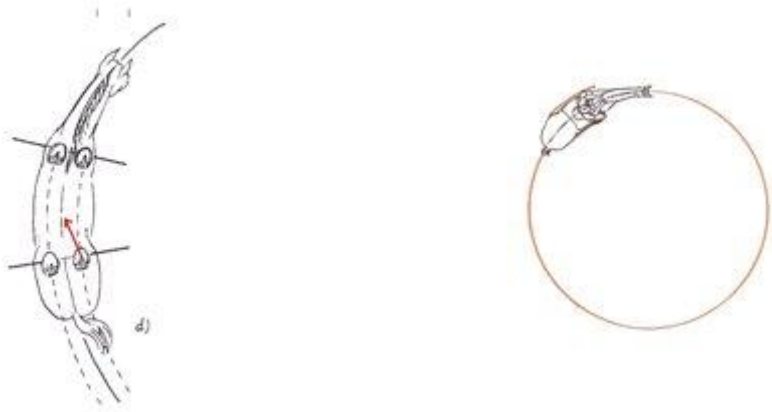
Correcte lengtebuiging Gelijkmatig gebogen volte (voor zover mogelijk)

Het paard buigt zich van staart tot oor.